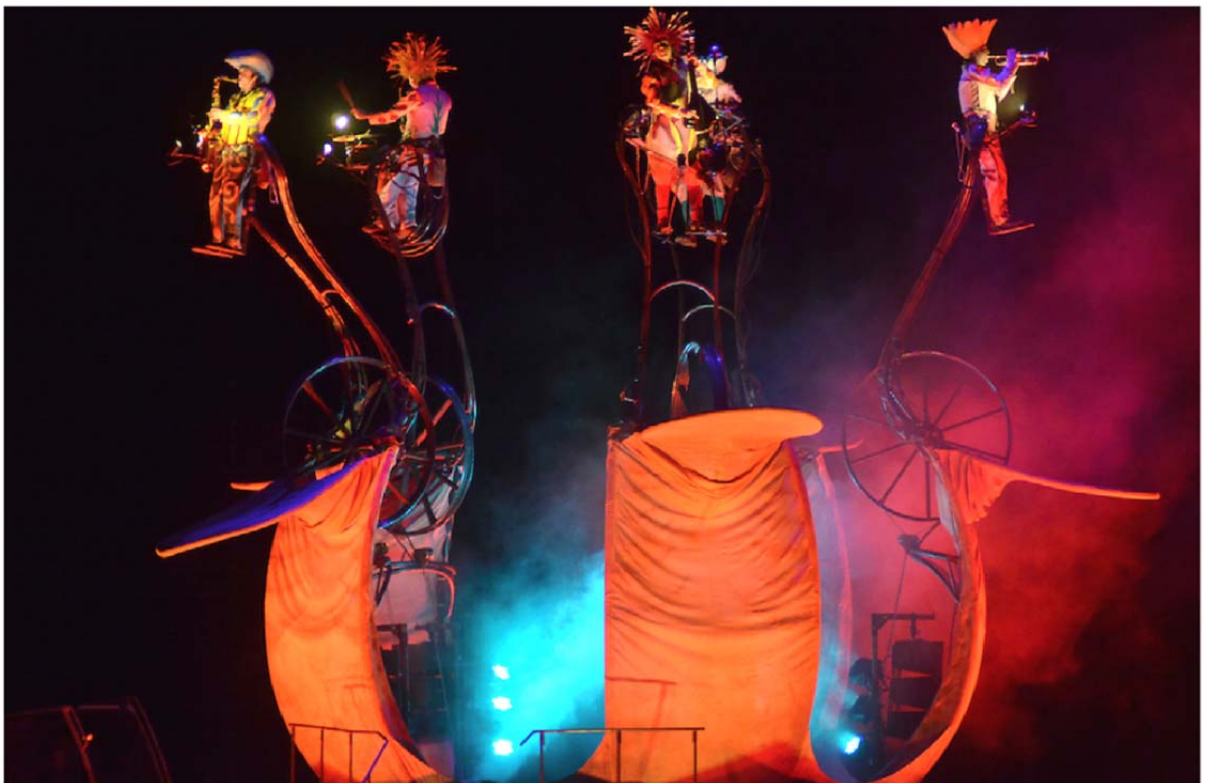
Transe Express