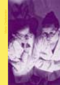
Les Gamettes Compagnie