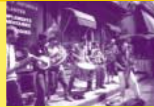
No Water Please