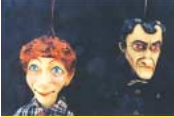
Société Royale Marionnettes St Gilloises Le Meunier des Fonds de Quarreux

Trois créatures intemporelles déambulent les unes derrière les autres. D'un pas lent et calme, elles dévoilent petit à petit leur monde : chapardages, caresses, cache-cache... et, à travers des mini-scènes pleines de tendresse, mettent le public dans des situations inattendues.