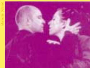
Compagnie du Tapis Franc