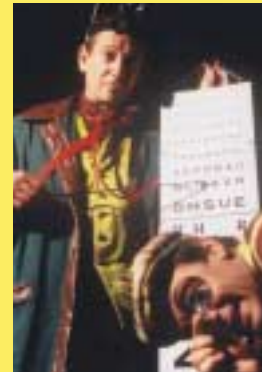
Carmelo et Perrotin