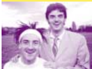
Compagnie Qualité Street