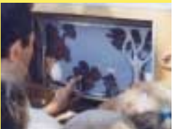
Ray Mundo Theater