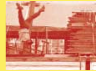
Pagnozoo, cirque équestre