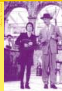
Compagnie du Tapis Franc