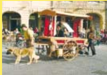
Société Royale Marionnettes St Gilloises Trois Grains de sable