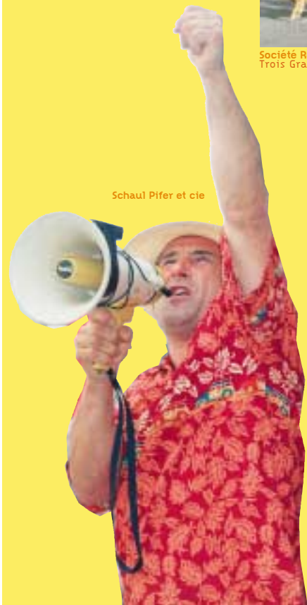
Schau Pifer et cie