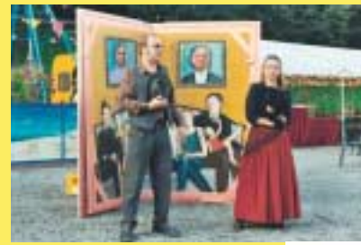
Compagnie des Bonimenteurs