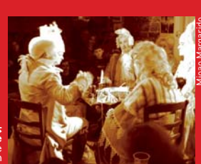
Compagnie des Femmes à Barbe La Taverne Münchhausen