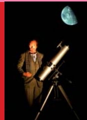
Christophe Reynaud de Lage