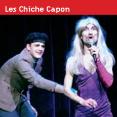
Les Chiche Capon