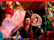
La Caravane Passe