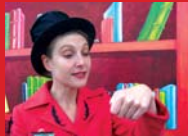
Thé à la Rue