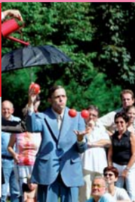
Bris de Banane