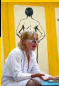
Thé à la Rue L'Homme idéal