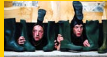
Le Grand Manipule Au débotté