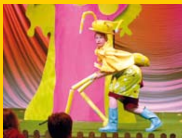
Compagnie Hubert Jappelle