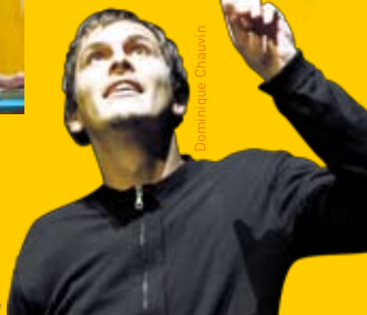
La Voix de l'Ourse

L'Homme idéal • Entresort féministe, interdit aux hommes (2h30 à 4h30) • Samedi 17h30, dimanche 17h30 • Parc, espace 4