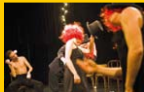
Cirque Bang Bang