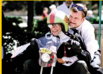
Le Grand Manipule Au débotté