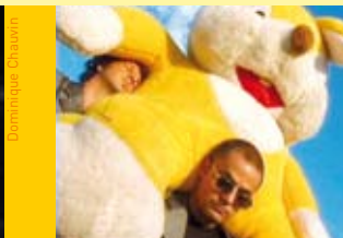
Tony Clifton Circus