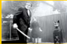
Douze balles dans la peau