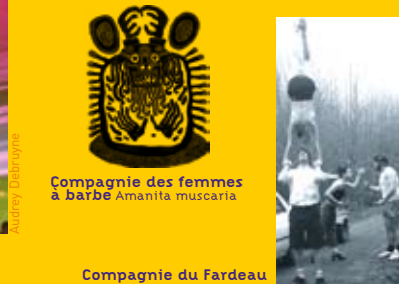
Compagnie du Fardeau

BALADEU'X (Belgique) Rires et rides • Cirque dansé et intergénérationnel (30 min) / création 2009 • Samedi 16h15 et 19h15, dimanche 16h15 • Parc, espace 4 Autour d'une balançoire, un jeune garçon énergique et insouciant et une dame courbaturée vont développer une relation drôle, touchante et culottée. Balles de rebond, mouvements acro-portés, détournement d'objets et surprises manipulatoires jalonnent ce moment sensible et plein d'humour.