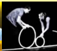
Sens dessus dessous