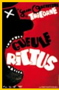
Le Théâtre du Tricorne